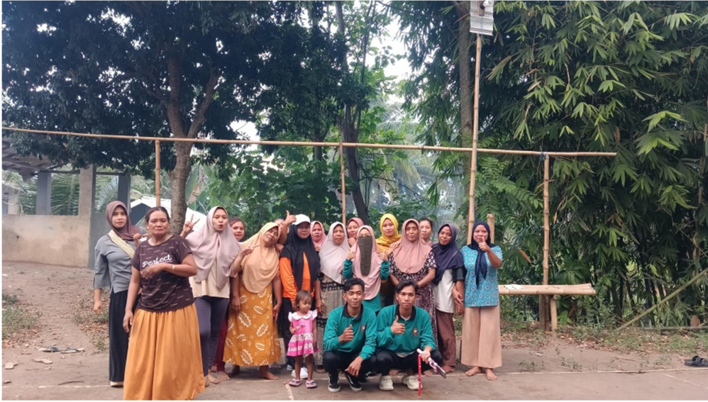
Gambar 3.1 Sosialisasi Kegunaan Tanaman Tradisional